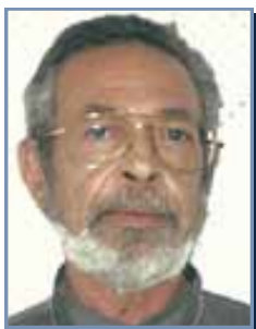
Speciallæge i Neurologisk Rehabilitering